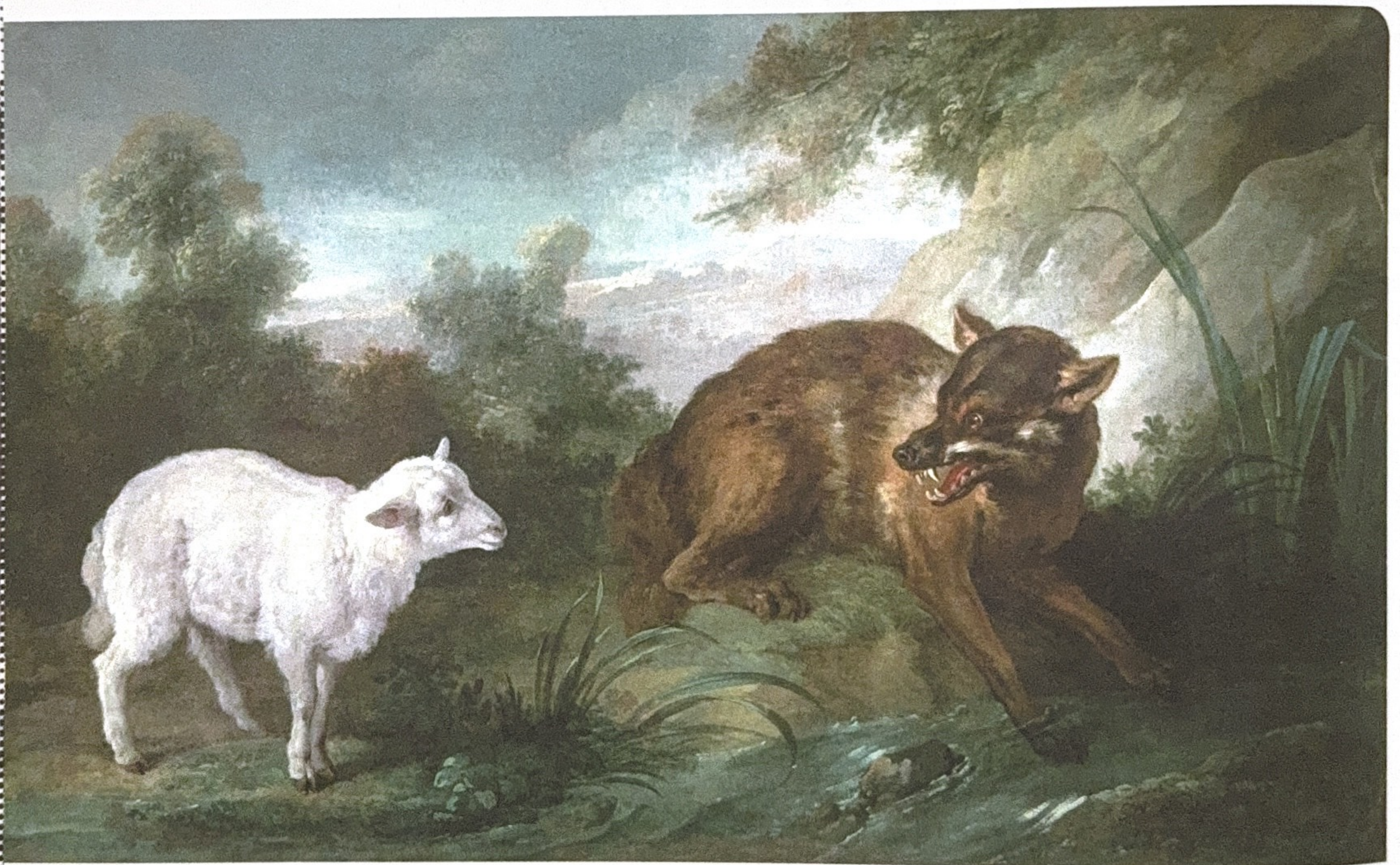
Le loup et l'agneau von Jean Baptiste Oudry, 1751.